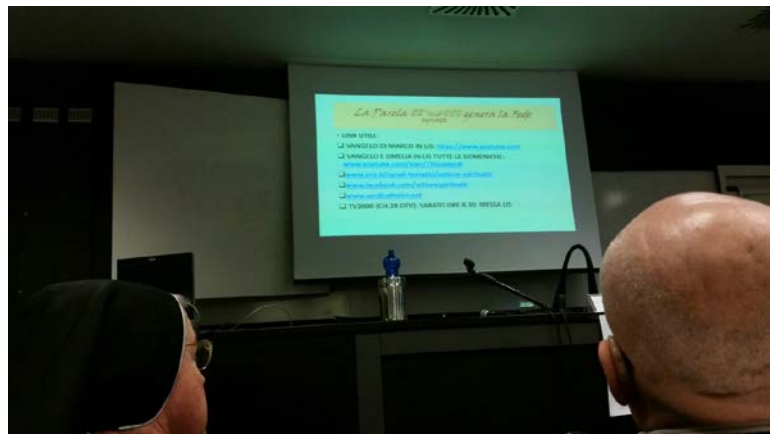
Bandiere delle Sezioni ENS esposte in Duomo e videata informatica durante il seminario all'Università Cattolica

Si è tenuta a Milano, sabato 28 novembre 2015, la 25ª «Giornata del Sordo in Lombardia», organizzata dal Consiglio Regionale ENS lombardo con un programma particolareggiato: concentramento dei partecipanti alle ore 9 in Piazza Duomo, «... accolti dallo Staff che collabora con il Consiglio Regionale ENS».